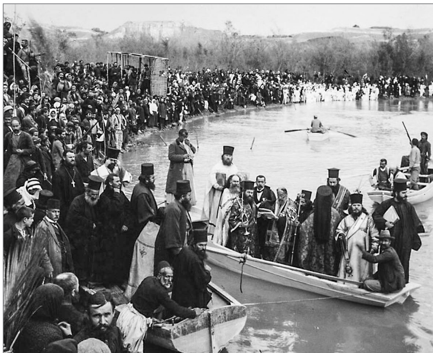
Православные паломники на Иордане.