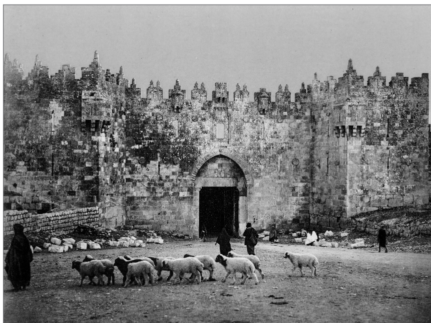
Дамасские ворота Старого Иерусалима. Открытка 1900 года