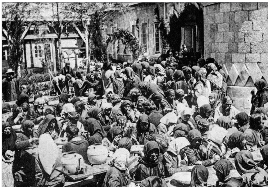
Русские паломники за трапезой на русском подворье в Иерусалиме.